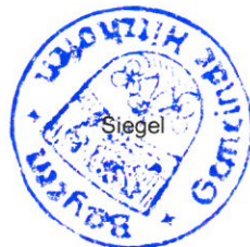
Roland Sammüller 1. Bürgermeister

Ortsüblich bekannt gemacht durch Anschlag an der Amtstafel am: 30.09.2019 Abnahme am: 06.11.2019