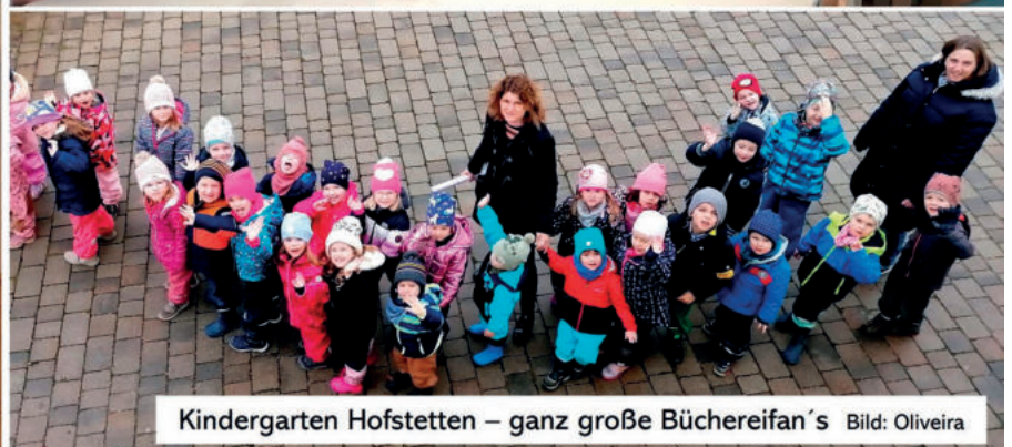
Kindergarten Hofstetten – ganz große Büchereifan's