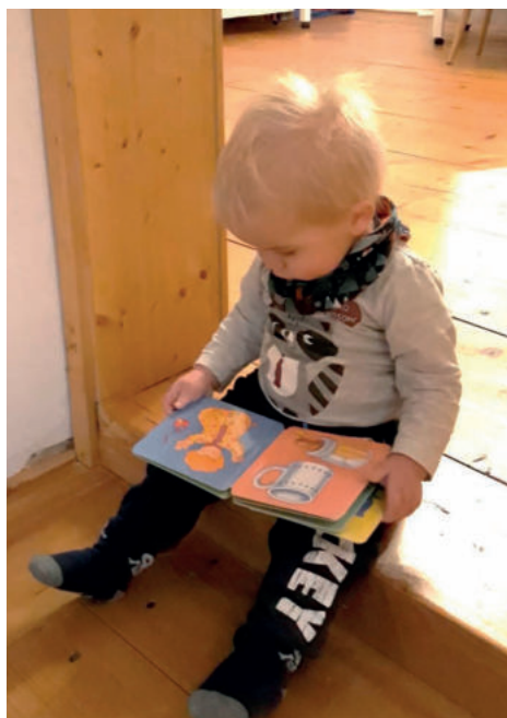
Ganz vertieft