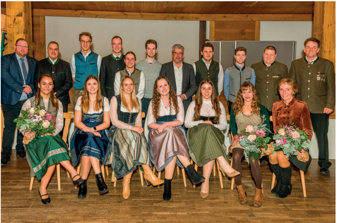
Foto: erfolgreiche Sportlerinnen und Sportler