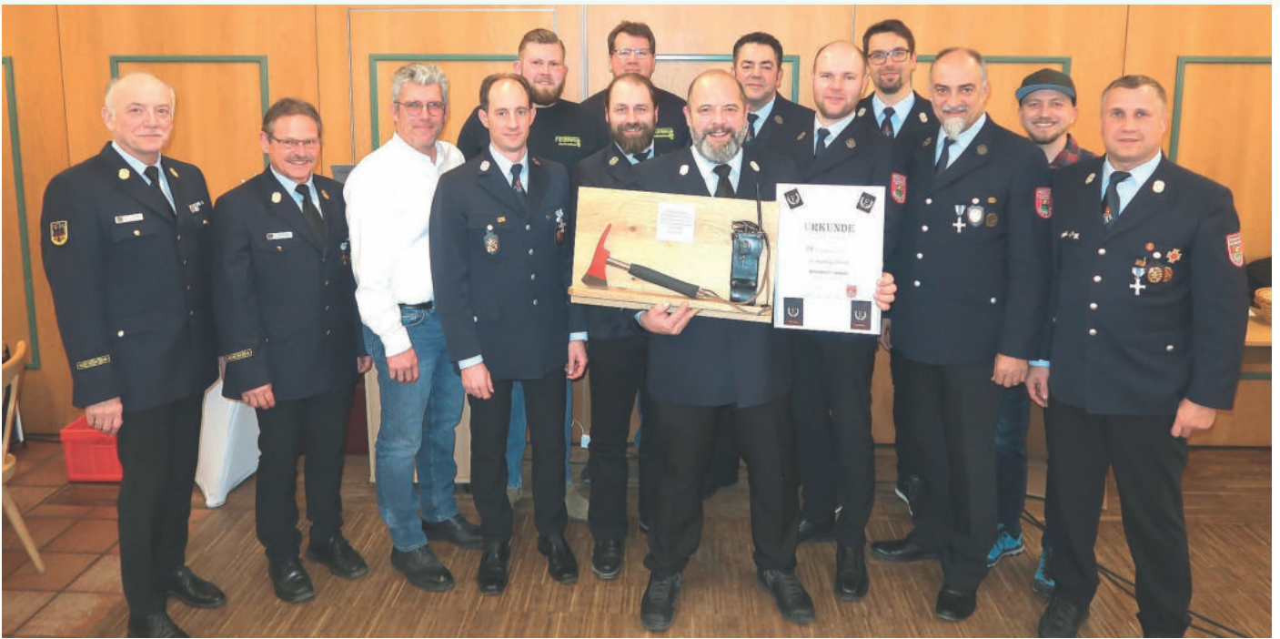
Die neugewählte Vorstandschaft mit den Geehrten und Ehrengästen