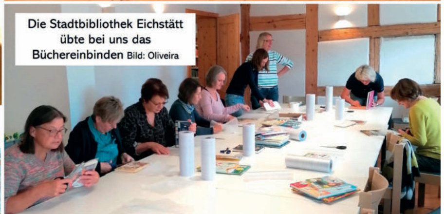
Die Stadtbibliothek Eichstätt übte bei uns das Buchereinbinden