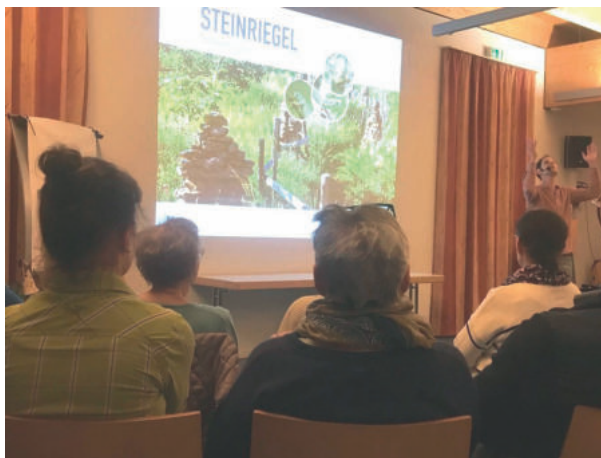
Texte & Bilder: Obst- und Gartenbauverein Hofstetten